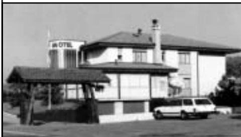
Motel des Pins – Cugy

Comptabilité – Bouclements – Révisions – Fiscalité – Conseils d'entreprises Estimations d'entreprises – Tous mandats fiduciaires – Analyses et planifications financières de communes – Révision annuelle des comptes communaux